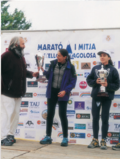
Entrega trofeos, carreras por montaña.

ración en los últimos años, el mantenerla sin profesionales contratados laboralmente a los que se les pueda exigir un trabajo serio y riguroso. El trabajo altruista y voluntarioso, que antaño era la forma de funcionamiento general a todos los niveles, hoy en día sólo es desarrollada por los miembros de la Junta Directiva a excepción de la dirección técnica, la cual se ha profesionalizado por necesidades de sacar los proyectos deportivos adelante.