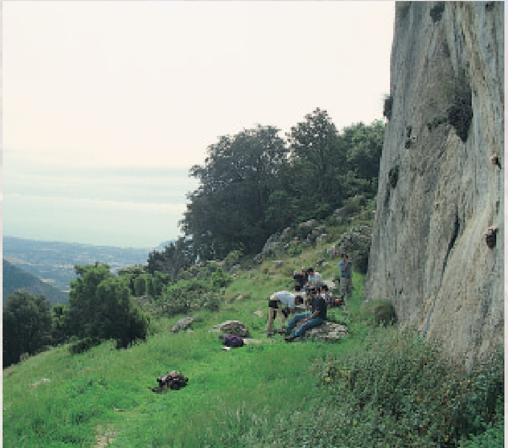
Font de la Solsida, Puig Campana (Finestrat) Curs Tècnic de Senders de la EVAM.

Hi ha a més dues activitats que es desenvolupen en medis molt específics i fràgils, l'escalada i el descens de barrancs. En ambdós casos, els indrets on es practiquen aquestes activitats concentren gran quantitat d'éssers vius d'incalculable valor ecològic, en especial pel que respecta a les plantes i a la nidificació d'aus. Aquesta federació, i per tant el col·lectiu muntanyer valencià, estem al capdavant amb una regulació, com s'ha dit abans, modèlica de l'esport tradicio-