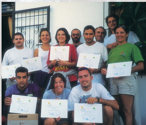
Curso de Formación de Deportistas.