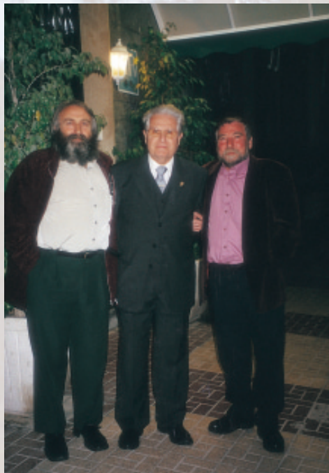
Reunión Presidentes Federaciones 2002.

de los ochenta con visitas a Cordillera Blanca (Perú), África y Yosemite, lo que le exigía un buen estado físico y técnico. ¿Puede practicar actividad deportiva asiduamente, o los compromisos institucionales le absorben?