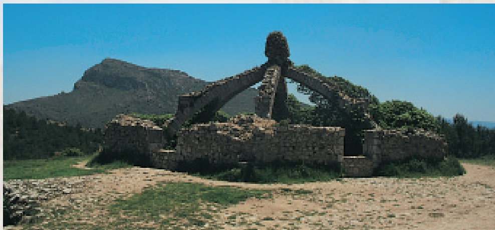
Foto 2: Cava Arquejada i Montcabrer al fons – Parc Natural de la Serra de Mariola

poden crear zones de reserva on l'accés estiga restringit, a més a més, tots els muntanyers, i en especial els federats, hem d'exigir a nivell personal i a través dels òrgans que ens representen, les federacions, davant les autoritats competents en medi ambient la necessitat de circular per senders i camins tradicionals balitzats, ja que aquests són els que porten el segell de qualitat que els dona la federa-