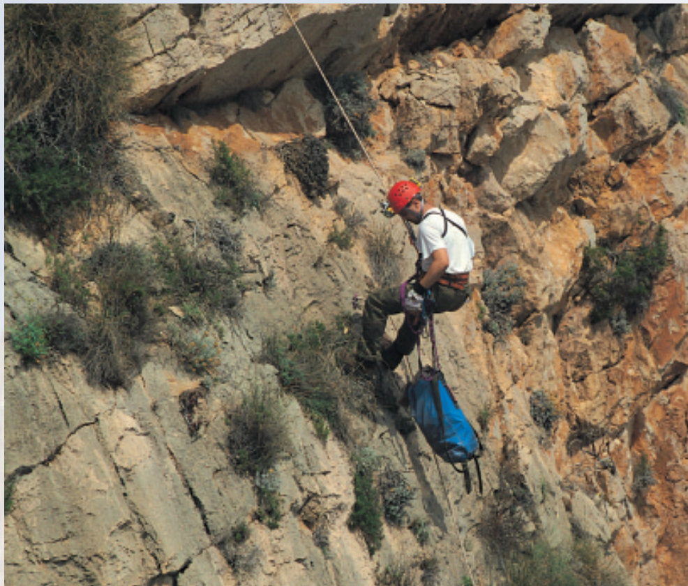
Cap d'Or (Teulada-Moraira). Escalador fent el cens d'espècies rupícoles de flora.

ressants, per tal d'augmentar el nostre coneixement dels seus habitants.