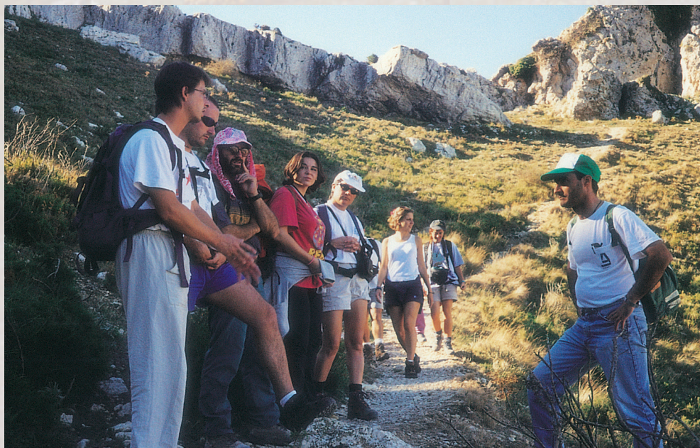
Curso de Formación Técnico de Senderos.

Horas de Formación: 360 horas teóricas + 200 horas prácticas.